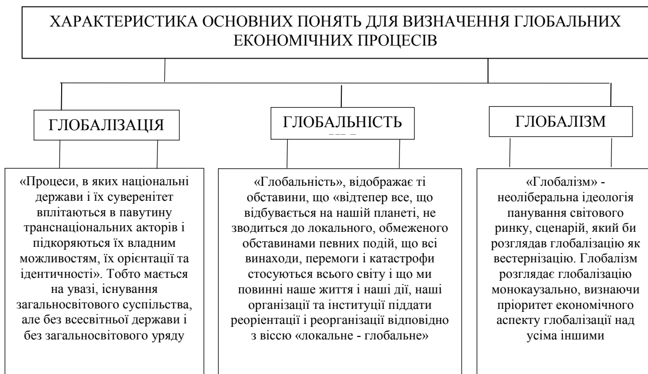
Рис. 1. Характеристика основних понять для визначення глобальних економічних процесів

Для того, щоб глибоко і системно розуміти глобальні процеси сьогодення, щоб підкреслити предмет дослідження, потрібно спиратися на основні поняття для визначення глобальних економічних процесів. В даному питанні ми посилаємось на У. Бека «Що таке глобалізація?» [7]. Отже У. Бек диференціює три поняття: глобалізація, глобальність і глобалізм.