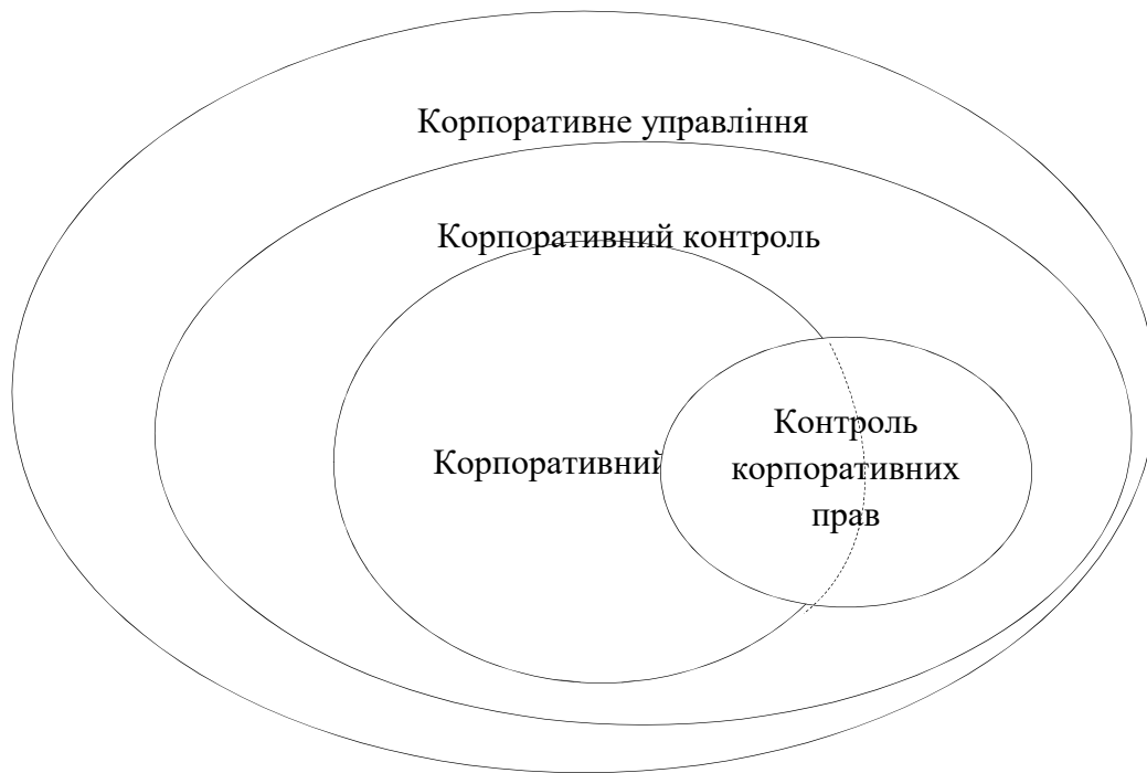
Рис. 1. Співвідношення понять «корпоративне управління», «корпоративний контроль», «корпоративний аудит та «контроль корпоративних прав»

На державному рівні в контролі за корпоративними правами особливе місце посідає Національна комісія з цінних паперів і фондового ринку України, оскільки саме цьому органу Законом України «Про державне регулювання ринку цінних паперів в Україні» [1] доручено здійснювати державне регулювання ринку цінних паперів, які і є основним втіленням корпоративних прав. Серед нормативних актів вищого рівня, які регулюють діяльність, пов'язану з корпоративними правами, варто виокремити Закон України «Про акціонерні товариства» [2], зважаючи на те, що він містить основоположні принципи діяльності емітентів корпоративних прав у вигляді акцій.