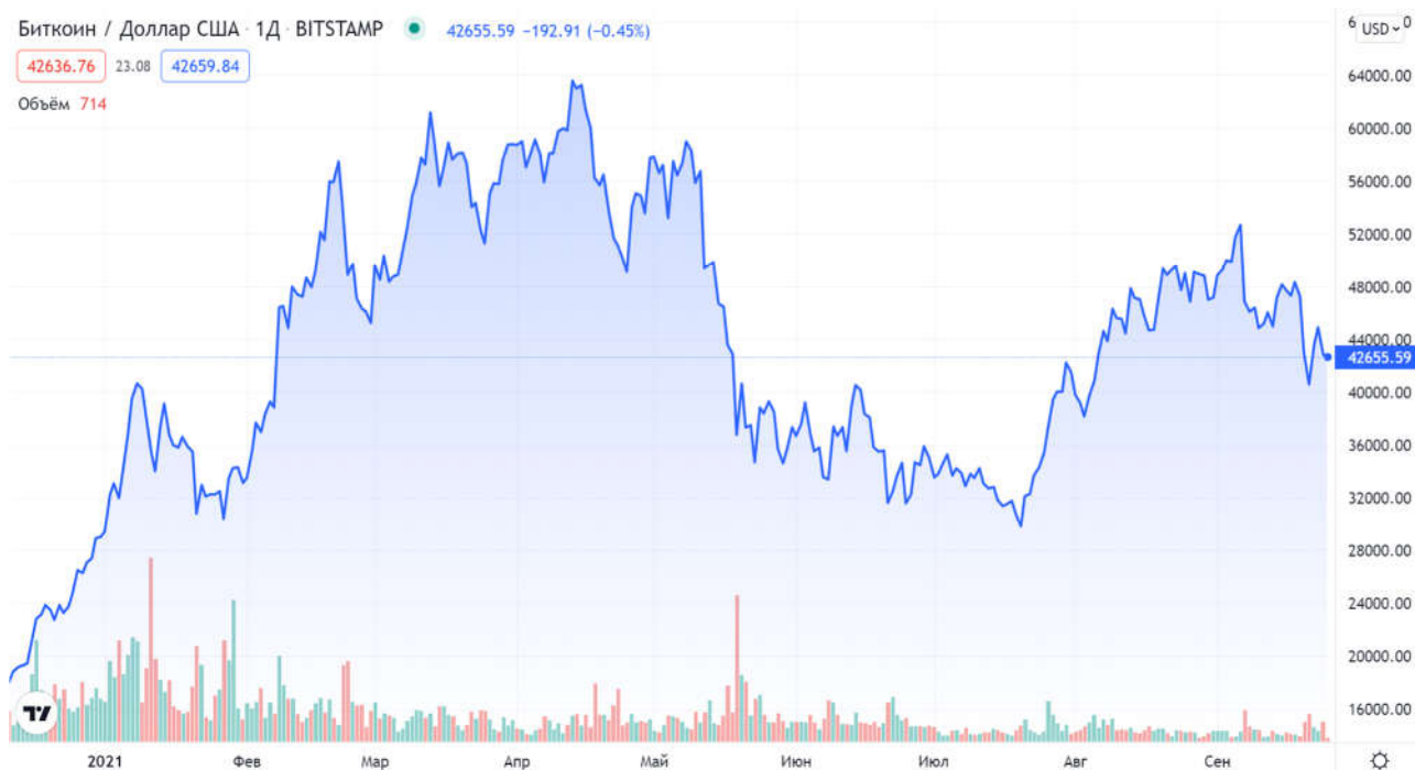
Рис. Динаміка курсу біткойна до долара в 2021 році [5]